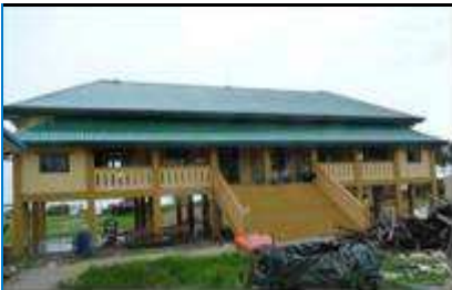
Eine von 15 neuen Schulen/Schutzzentren in Bogalay

Sehr gerne nehmen wir jederzeit eure Kommentare und Anregungen für unseren Newsletter auf.